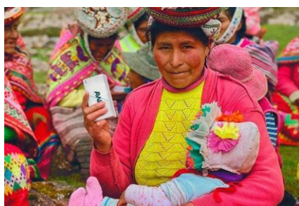
Εικόνα SEQ Εικόνα \* APABIKA 1: Μια γυναίκα από το Περού με σαπούνι στο χέρι

Στο Περού, όπως και σε άλλες περιοχές του κόσμου, η πρακτική του πλύσιματος των ρούχων στα ποτάμια εξακολουθεί να είναι διαδεδομένη. Δυστυχώς, το σαπούνι που χρησιμοποιείται για το πλύσιμο των ρούχων στα ποτάμια είναι συχνά ιδιαίτερα ρυπογόνο, καθώς το νερό στο οποίο πλένουν τα ρούχα τους είναι επίσης το νερό που πίνουν και χρησιμοποιούν για να ποτίσουν τα χωράφια τους και να ετοιμάσουν το φαγητό τους.